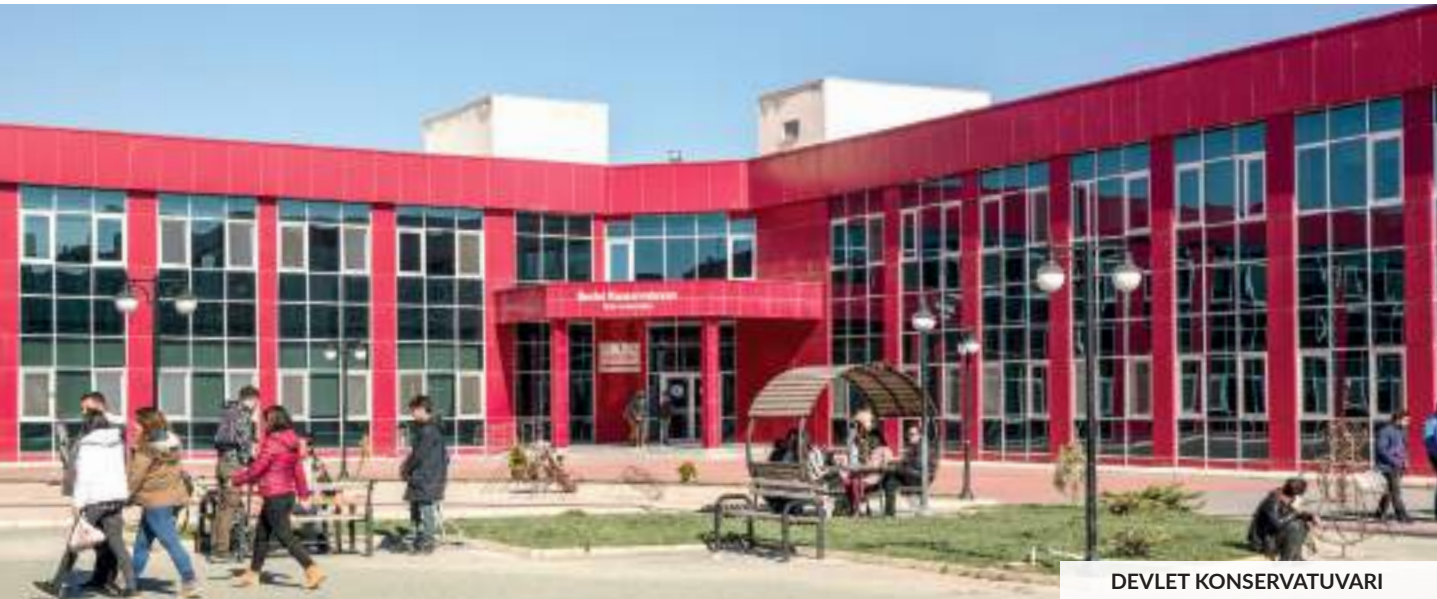
DEVLET KONSERVATUVARI STATE CONSERVATORY