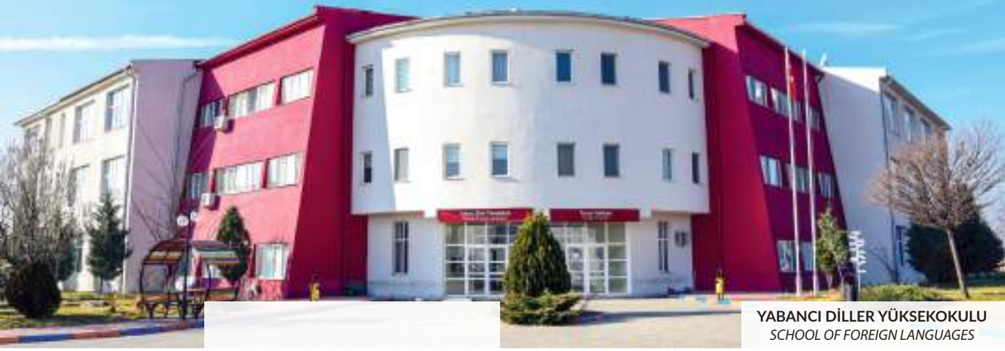
YABANCI DİLLER YÜKSEKOKULU SCHOOL OF FOREIGN LANGUAGES