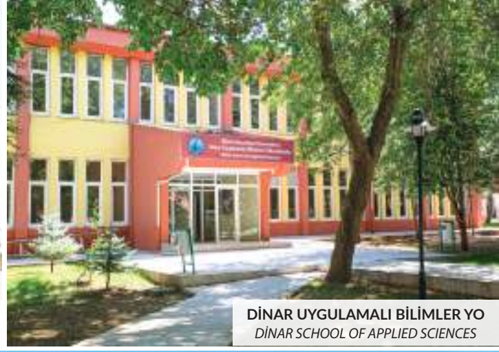
DİNAR UYGULAMALI BİLİMLER YO DİNAR SCHOOL OF APPLIED SCIENCES