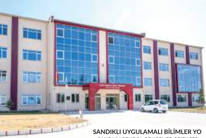
SANDIKLI UYGULAMALI BİLİMLER YO SANDIKLI SCHOOL OF APPLIED SCIENCES